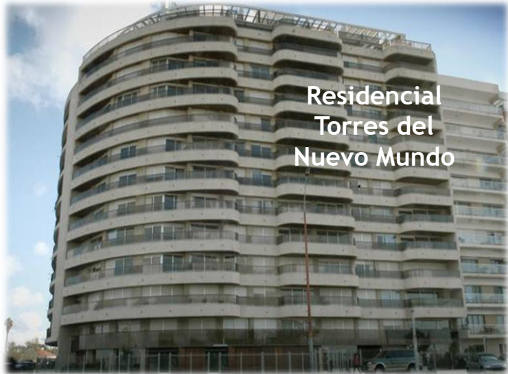
Residencial Torres del Nuevo Mundo