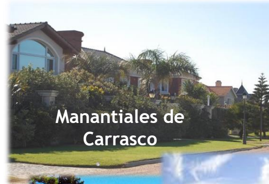
Manantiales de Carrasco