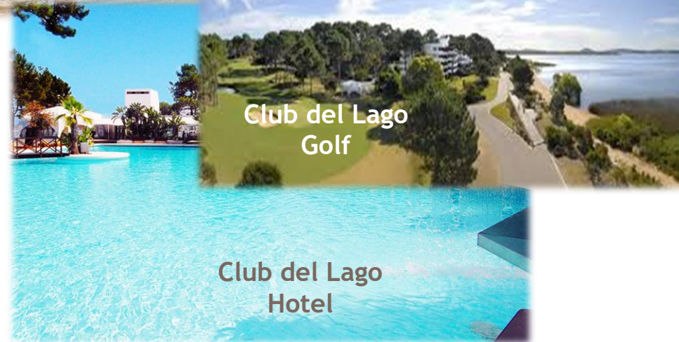
Club del Lago Golf