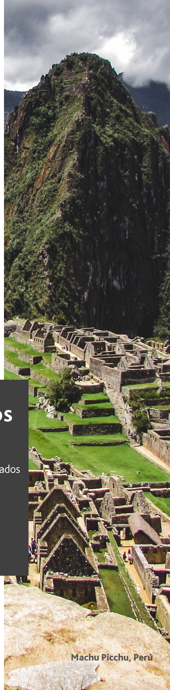
Machu Picchu, Perú