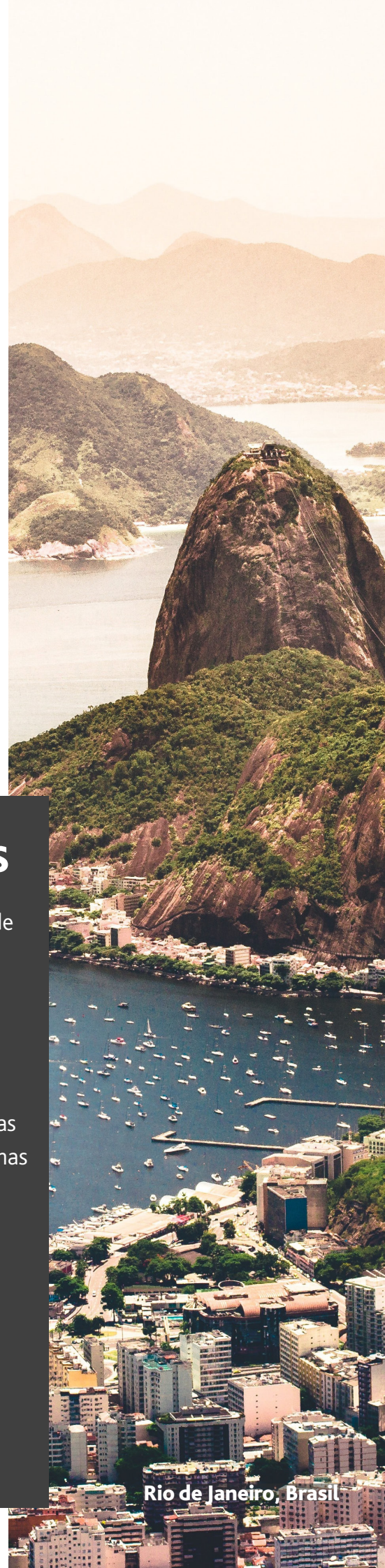
Rio de Janeiro, Brasil