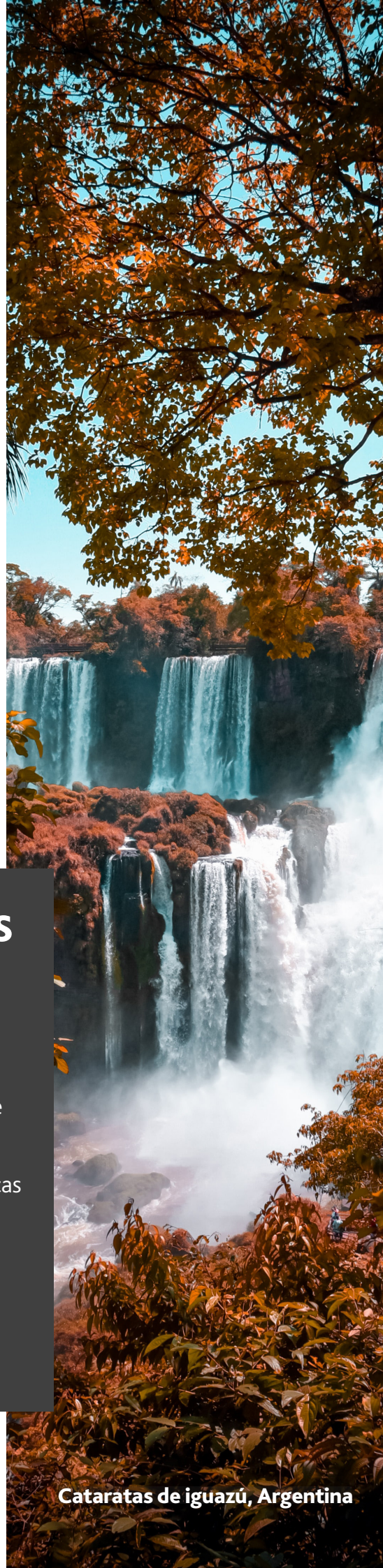
Cataratas de Iguazú, Argentina